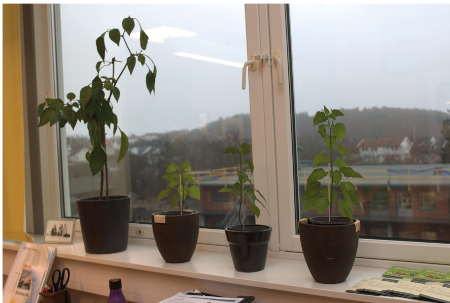
Rektors kontor på Flekkerøy skole er som en grønn oase, med chili, blåbær, paprika og sitron i vinduskarmen.