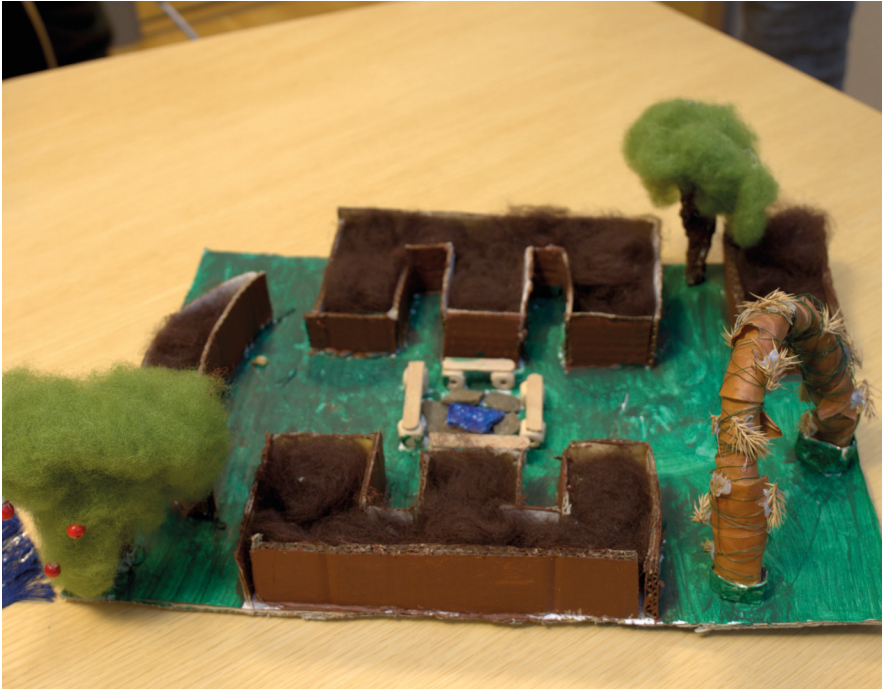
Da Flekkerøy skole skulle etablere skolehage ble elevene utfordret til å lage modeller av skolehagen. Dette er vinnermodellen "Haveflekken", som skolehagen heter.